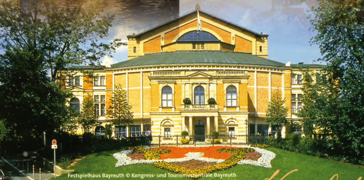
Festspielhaus Bayreuth