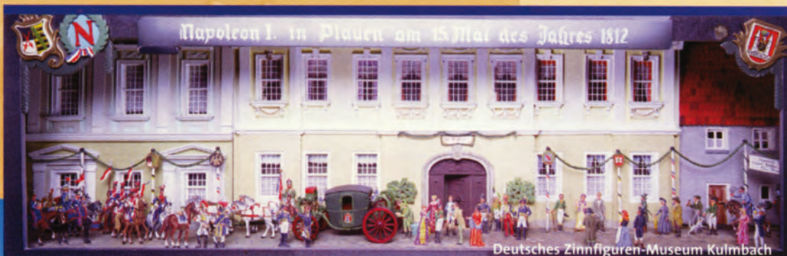
Deutsches Zinnfiguren-Museum Kulmbach